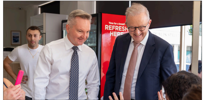
Chris Bowen and Anthony Albanese meet local residents

Since 2002, Delizioso Bakery has become a cornerstone of Smithfield, offering authentic