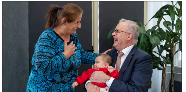
Anthony Albanese is welcomed by the Smithfield community

Nel corso degli anni, la processione ha visto una partecipazione sempre crescente, diventando un simbolo di continuità e appartenenza. Un appuntamento che, anche nel 2026, ha unito fede, memoria e comunità, rinnovando un pezzo di storia italiana nel cuore di Marrickville.